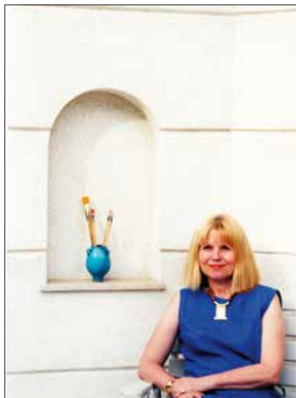
Máriaremetén a kertben