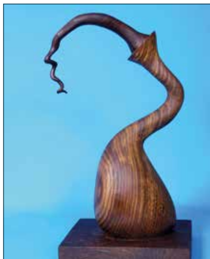
Casanova magánya – tölgy- és szilvafa