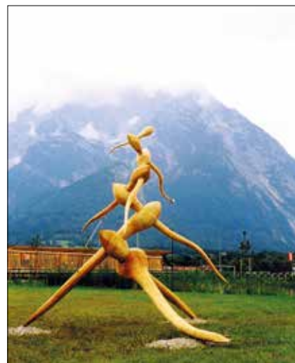
Életfa – vörösfenyő

napig a tanítás biztosítja. Tíz éven át Budapesten a Jaschik Ákos Művészeti Szakközépiskolában tanítottam, most pedig a kaposvári Zichy Mihály Művészeti Szakközépiskola tanára vagyok. Tanítványaimat nem akarom mindenáron a művész életformára rábeszélni, mert nagyon nehéz ezen a pályán érvényesülni. Az a lényeg, hogy az életben mindenki találja meg a helyét.