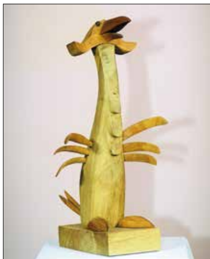
Kismadár – tölgy- és cseresznyefa